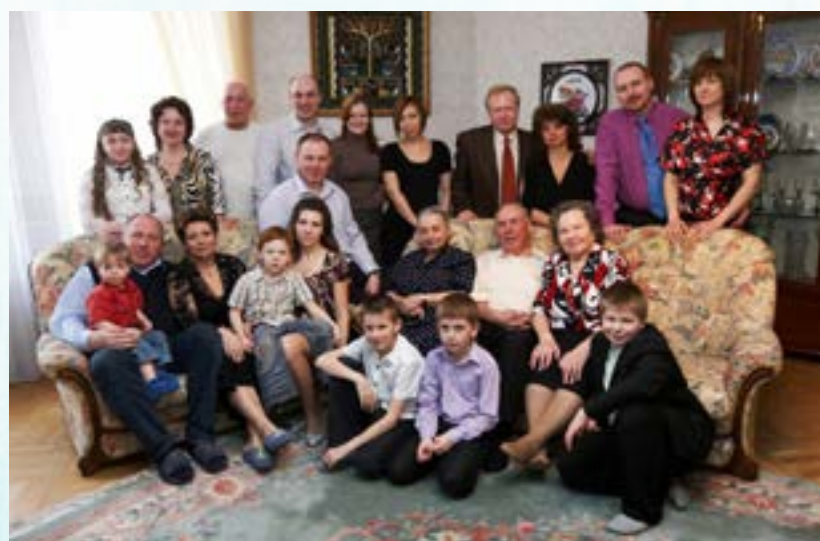
и замечательный дедушка.

Клуб «Новосибирск» с гордостью выдвигает кандидатом в губернаторы одного из опытейших ротарианцев нашего округа!